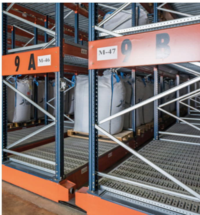
Fotocélulas de proximidad

Una de las ventajas más destacadas de las estanterías Movirack es el considerable aumento del volumen de almacenaje, al aprovechar el espacio disponible