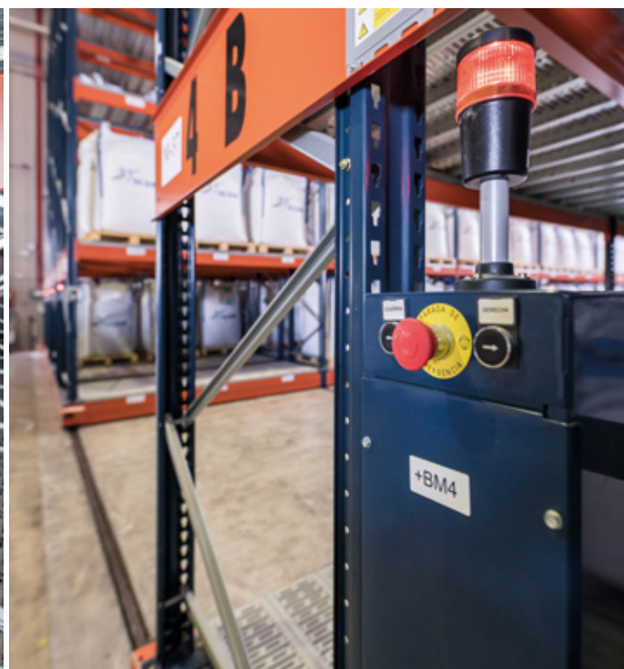
Setas de emergencia